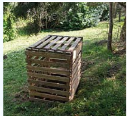
Composteurs individuel fabriqué avec des palettes en bois