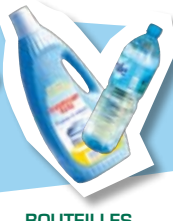
BOUTEILLES PLASTIQUE avec leur bouchon