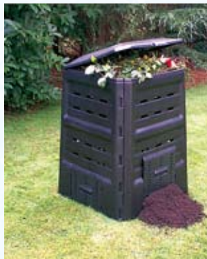
Composteurs individuel en plastique prêt à l'emploi

Le compostage en bac est donc à privilégier. Si vous choisissez cette option, vous pouvez acheter un composteur prêt à l'usage (environ 35 000 F pour un modèle de 470 litres) ou le réaliser vous-même. Quelques planches de palettes suffisent pour fabriquer un composteur individuel d'environ 1m 3 , idéal pour un jardin de 500m 2 .