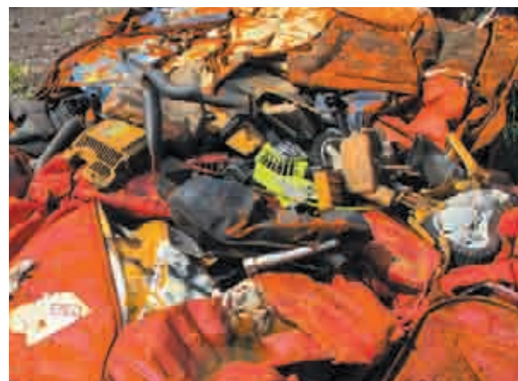
Après compactage mélangé avec des drums.