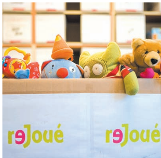
Plutôt que de jeter les jouets dont les enfants ne veulent plus, donnons-les à "Rejoué".

Source : http://rejoue.asso.fr/actualites