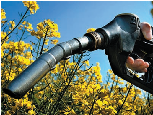
Le biocarburant explore de nouvelles pistes en utilisant les graisses animales.

Le biodiesel se réinvente en explorant une composition à base de graisses animales . Le Groupement des Mousquetaires et Saria France créent ESTENER , la toute première unité de production de biocarburant issue de graisses animales en France. Le procédé est simple : les graisses sont extraites des déchets de viandes non comestibles et impropres à la consommation grâce à l'équarrissage. Puis elles sont transformées en ester méthylique d'huile animale (EMHA) . Pour produire 100 tonnes d'EMHA, il faut 100 tonnes de graisses et 10 tonnes de méthanol. On obtient alors 100 tonnes de biodiesel et 10 tonnes de glycérine. L'usine ESTENER, dimensionnée pour le marché français, peut produire quelques 75 000 tonnes de graisses par an.