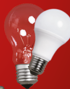
▶ AMPOULES ET NÉONS