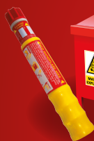
▲ FUSÉES DE DÉTRESSE