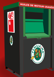
▲ HUILES DE MOTEUR