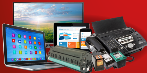
▲ ÉLECTRONIQUES (D.E.E)