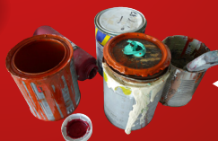
◀ PEINTURES ET SOLVANTS

TOUS CES DÉCHETS TOXIQUES NE PEUVENT PAS ÊTRE MÉLANGÉS AVEC LES DÉCHETS DE CATÉGORIE 2 OU 3.