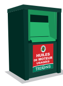
HUILES DE MOTEUR