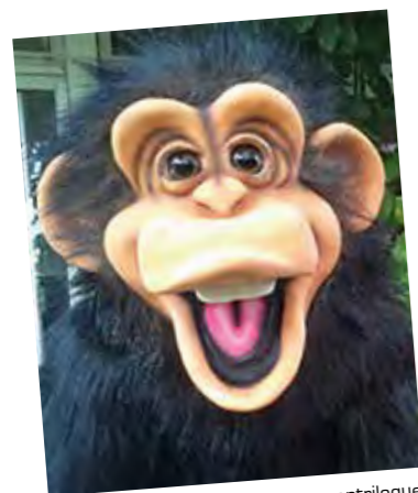
MARTIN le singe ventriloque.

la prévention des risques liés à l'électricité, et à la lutte contre le gaspillage de l'eau. Cette année, la durée du spectacle a été réduite au profit d'un grand jeu interactif organisé à la fin mettant en application les différents éco-gestes qui ont été décrits pendant le spectacle comme, par exemple,