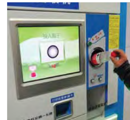
20 bouteilles plastiques contre 1 ticket de métro.

En Chine, fin 2012, de drôles de machines s'installent à côté des distributeurs de tickets de métro habituels. Ce sont des bornes de paiement particulières : des bouteilles en plastique usagées contre un ticket de métro ! Ce principe gagnant/gagnant encourage le recyclage tout en faisant des économies . La société chinoise Incom, spécialisée dans l'élaboration de solutions de recyclage intelligentes, a installé ces distributeurs dans une quinzaine de stations du métro de Pékin (3 e plus important au monde). En insérant 20 bouteilles plastiques vides , on crédite sa carte de transport et s'offre un ticket. Le succès est là, à tel point qu'Incom envisage d'installer 3 000 appareils à travers la ville, sur d'autres lignes de métro, dans les écoles, aux arrêts de bus ou dans les centres commerciaux. Le même procédé pourrait aussi être mis en place pour le recyclage des canettes métalliques .