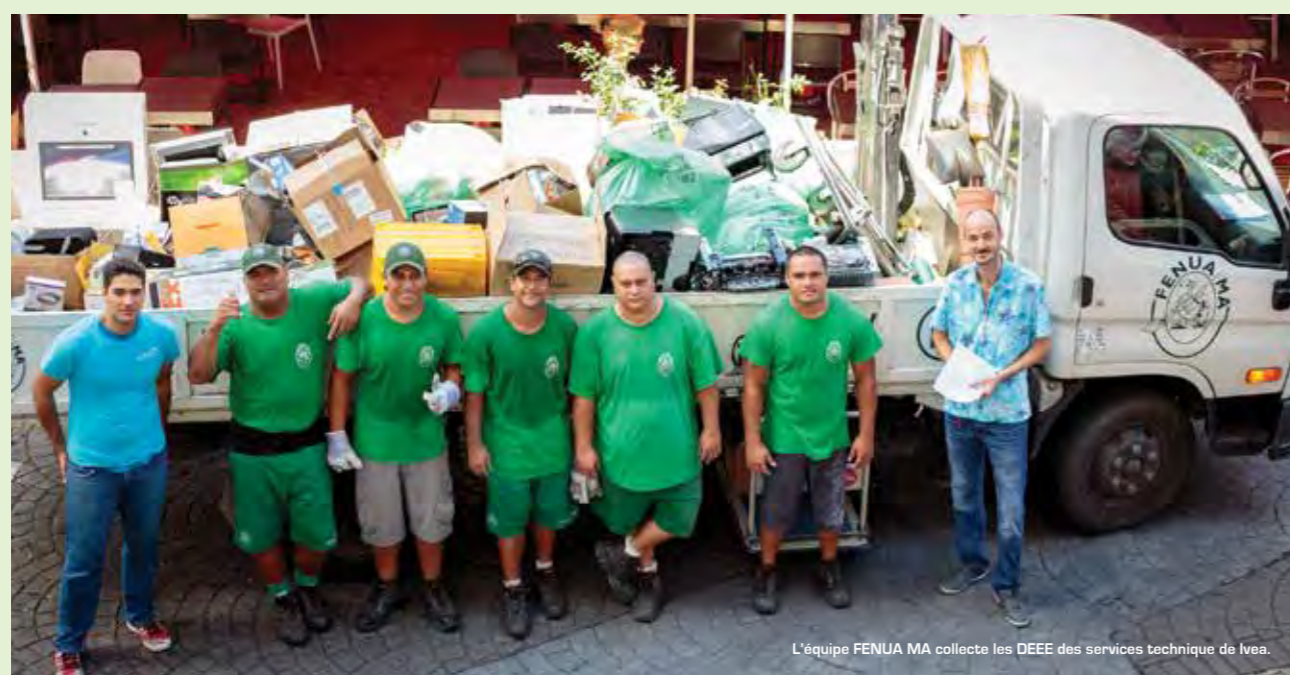
L'équipe FENUA MA collecte les DEEE des services technique de Ivea.

Pour rappel, les DEEE sont des déchets extrêmement toxiques qui ne doivent pas être jetés n'importe où. Ils nécessitent d'un traitement spécial avant de pouvoir être exportés vers des filières adaptées.