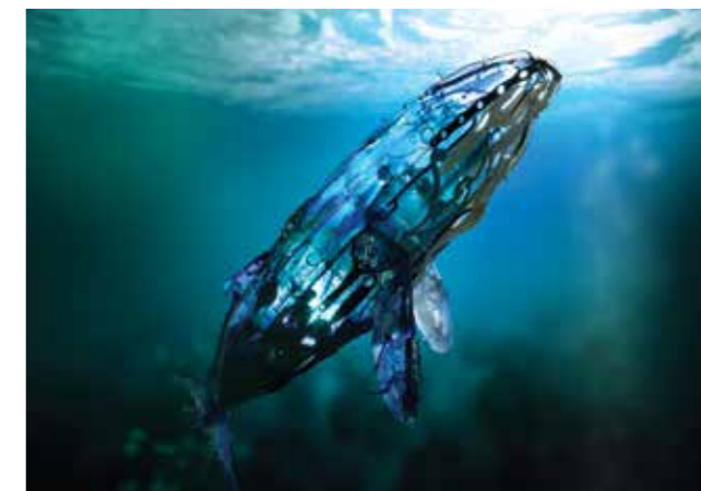
Plus vraie que nature ? Une œuvre miroir forte.

Sayaka Ganz est une artiste qui sait animer la matière pour offrir à nos yeux des œuvres majestueuses et vivantes. Inspirée par la philosophie japonaise shintoïste , qui enseigne qu'il existe un esprit dans chaque chose matérielle, objets et organismes, Sayaka Ganz utilise comme matière première nos déchets plastiques . Son travail, entamé depuis près de 5 ans maintenant, n'en finit pas de séduire, et, régulièrement, il revient dans l'actualité au grès des expositions de l'artiste, comme celle qui s'est tenue en Floride en Août. Les œuvres de Sayaka Ganz transmettent un message fort , destiné autant à nous faire réfléchir sur notre consommation, notre manière de trier, que sur le sort réservé aux animaux et à la planète .