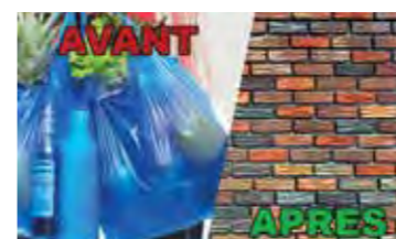
Des briques en plastique recyclé, il fallait y penser.