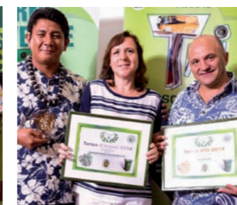
Hôtel The Brando - Tortue d'Or Hôtel Intercontinental - Tortue d'Argent