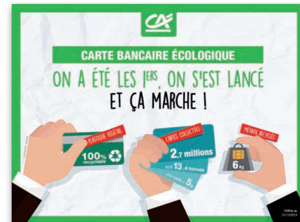
Le Crédit Agricole innove en matière de fabrication et récupération des cartes bancaires pour en diminuer l'impact écologique.