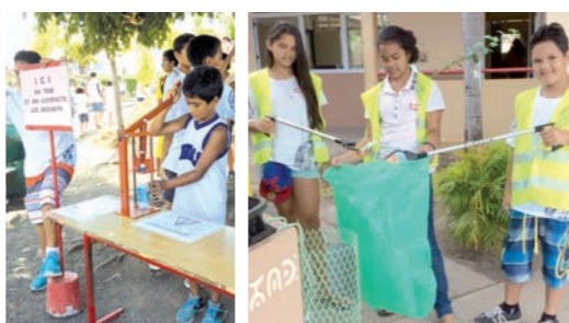
Le tri est systématiquement appliqué lors des manifestations organisées au collège.

EN PLUS DE LA CONVENTION SIGNÉE AVEC FENUA MA EN OCTOBRE 2012 ET LA MISE EN PLACE DU TRI SÉLECTIF AU SEIN DE VOTRE ÉTABLISSEMENT, QUELLES SONT LES AUTRES ACTIONS QUE VOUS AVEZ MISES EN PLACE ?