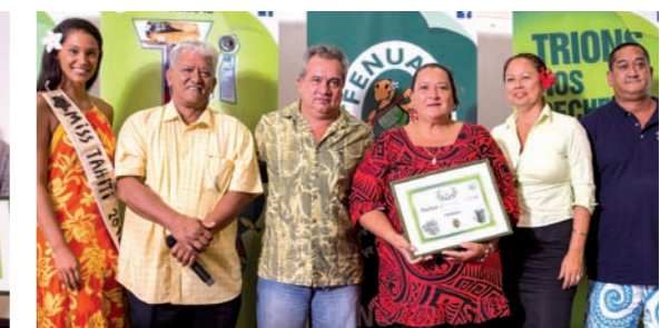
La commune de Punaauia obtient la tortue d'Argent.

Retrouvez toutes les photos de la cérémonie sur fenuama.pf