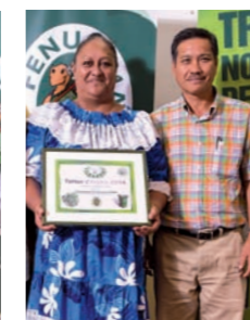
Communauté de Communes Hava'i - Tortue d'argent des îles éloignées