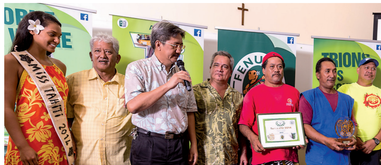
La commune d'Arue remporte la tortue d'Or pour la 8 e année consécutive !