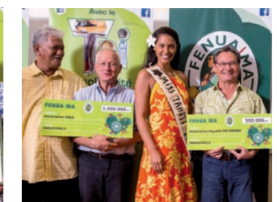
La Saga, SOS Village enfants Papara, et Social Police 2000 ont été récompensés par les industriels : 1.7 million.