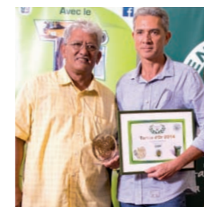
CHPF - Tortue d'Or des Entreprises

De plus en plus d'associations ou d'organismes jouent le jeu et font trier leurs participants pendant des événements publics. En signant une convention avec FENUA MA de prêt de corbeilles publiques et de dons de sacs poubelles pour instaurer le tri sélectif pendant leurs manifestations publiques sportives ou culturelles, ces organismes participent à la sensibilisation globale du tri des déchets. C'est la raison pour laquelle FENUA MA a décidé de créer une nouvelle catégorie afin de les récompenser.