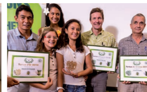
Collège de Punaauia - Tortue d'Or Collège de Pao Pao - Tortue d'Argent Collège d'Arue - Tortue de Bronze