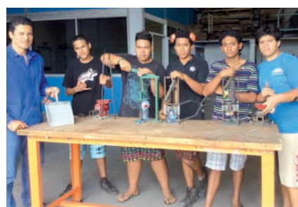
Fabrication de compacteurs par les élèves de la section SEGPA. Les éco-délégués en formation.

« Tout d'abord, ils ont été formés très tôt dans l'année et leur mission est de véhiculer au sein de la classe et leur mission est de véhiculer au sein de la classe la nécessité de bien trier les déchets . Ils s'assurent que la salle reste propre à la sortie des cours. Au départ les éco-délégués étaient perçus comme des « éboueurs » de l'établissement, puis petit à petit leur image a changé pour devenir des protecteurs de l'environnement, à tel point qu'ils apprécient de porter le gilet jaune FENUA MA et collecter les déchets recyclables dans la cour ».