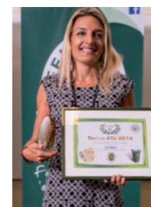
DB Tahiti - Tortue d'Or des organisateurs d'événements publics.